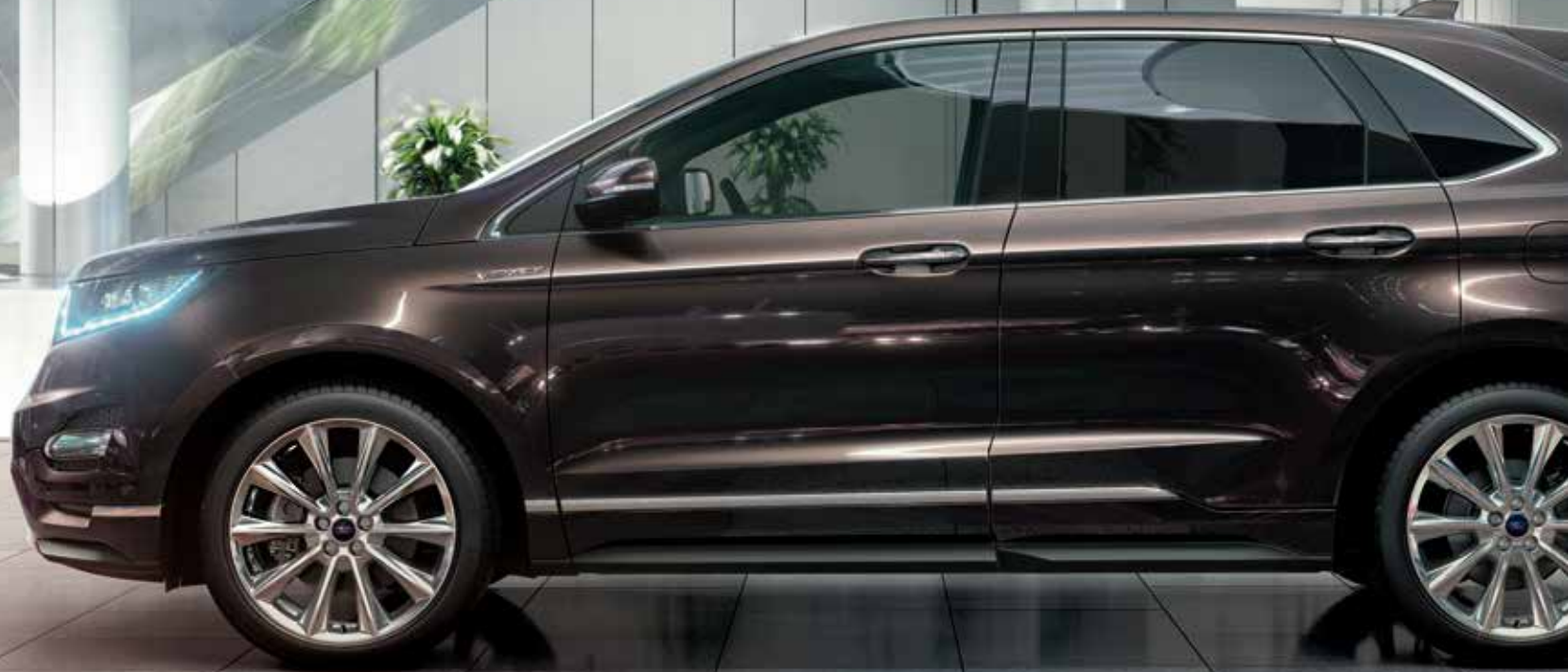
Ford Edge Vignale z 20" obręczami kół ze stopów lekkich bez dopłaty