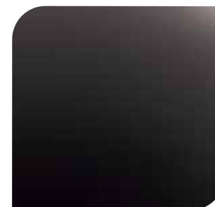
Ametista Scura 1 600,- lakier metalizowany specjalny