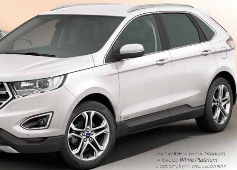
Ford EDGE w wersji Titanium w kolorze White Platinum z opcjonalnym wyposażeniem