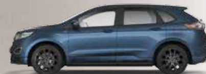
Chrome Blue 3 400,- lakier metalizowany