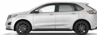
White Platinum 5 000,- lakier metalizowany specjalny