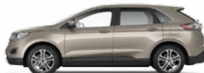
White Gold 3 400,- lakier metalizowany nieдоступny dla wersji ST-Line