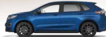
Lighting Blue 3 400,- lakier metalizowany