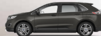
Magnetic Grey 3 400,- lakier metalizowany nieдоступny dla wersji ST-Line