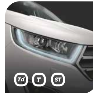
Reflektory Ford Dynamic LED