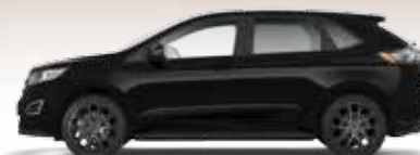
Mica Shadow Black 3 400,- lakier specjalny