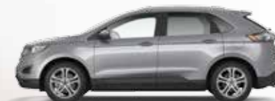
Ingot Silver 3 400,- lakier metalizowany