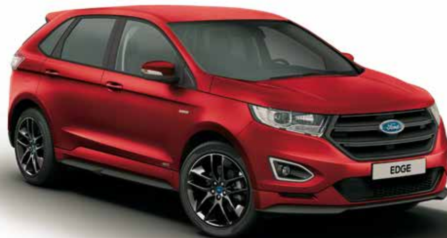
Ford EDGE w wersji ST-Line w kolorze Ruby Red z opcjonalnym wyposażeniem