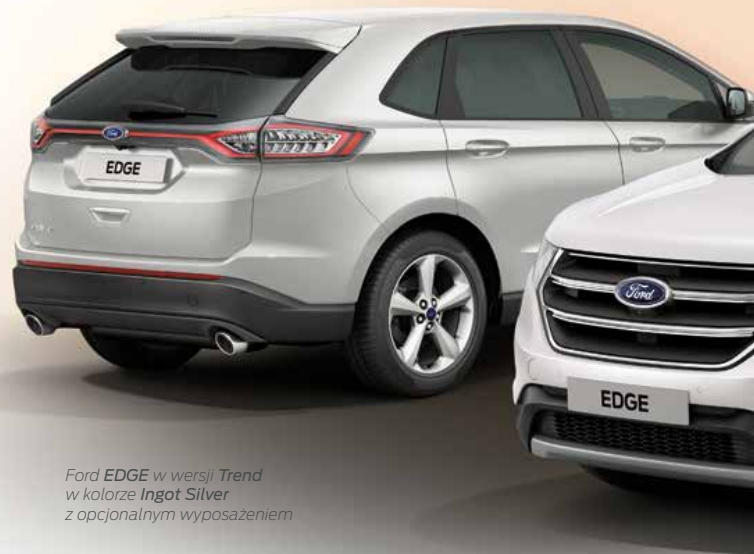
Ford EDGE w wersji Trend w kolorze Ingot Silver z opcjonalnym wyposażeniem