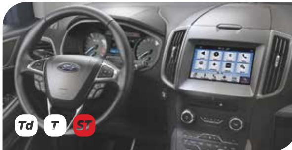
Ford SYNC 3 z 8" wyświetlaczem dotykowym