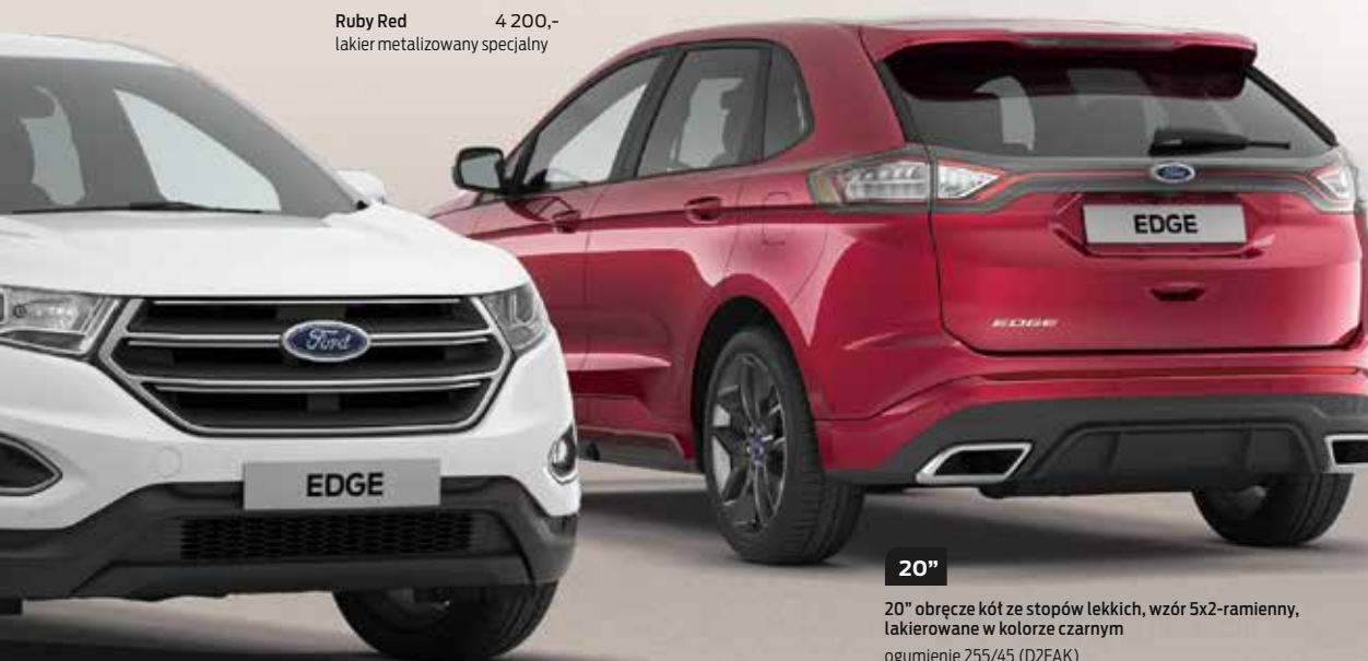
Ruby Red 4 200,- lakier metalizowany specjalny