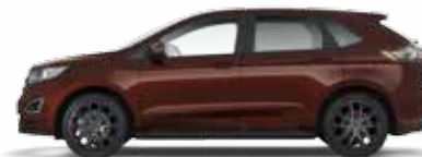
Burgundy Velvet 4 200,- lakier metalizowany specjalny