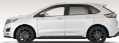
Oxford White bez dopłaty lakier zwykły

20" obręcze kół ze stopów lekkich, wzór 5x2-ramienny, częściowo z wykończeniem maszynowym ogumienie 255/45 (D2FCU)