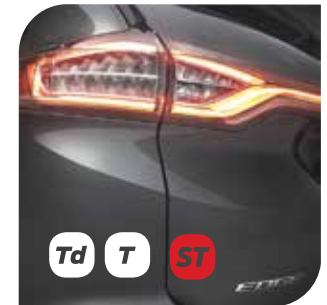
Tylne światła LED