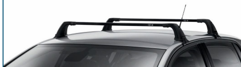
BEŁKI POPRZECZNE BAGAŻNIKA DACHOWEGO