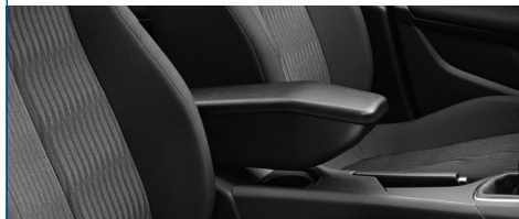
PODŁOKIETNIK ŚRODKOWY ZE SCHOWKIEM