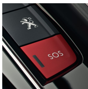
SYSTEM PEUGEOT CONNECT SOS&ASSISTANCE