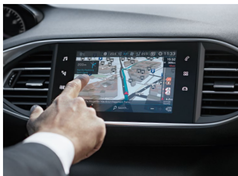
PEUGEOT CONNECT NAV