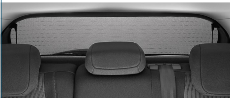
ZASŁONA PRZECIWSŁONECZNA TYLNA