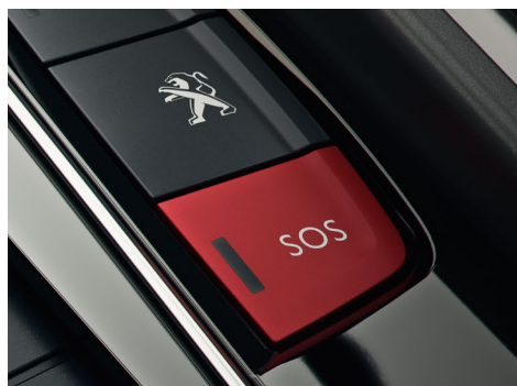
SYSTEM PEUGEOT CONNECT SOS&ASSISTANCE