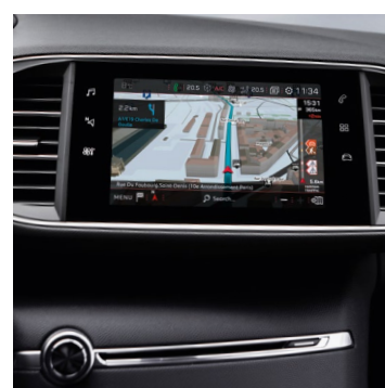
PEUGEOT CONNECT NAV + CD