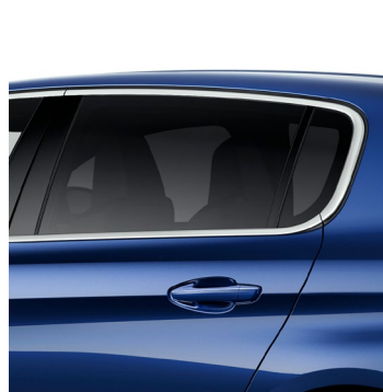
PRZYCIEMNIANE SZYBY TYLNE