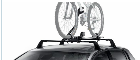
UCHWYT NA ROWER PRORIDE