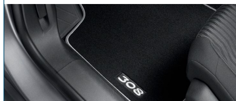
KOMPLET DYWANIKÓW MATERIAŁOWYCH