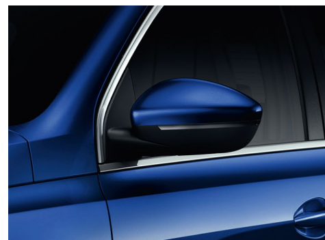
LUSTERKA BOCZNE SKŁADANE ELEKTRYCZNIE