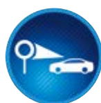
Układ rozpoznawania znaków drogowych (RSA)*

System określa położenie linii na jezdni i w przypadku przekroczenia ich bez użycia kierunkowskazu emituje ostrzeżenia dźwiękowe i wizualne.