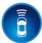
Układ wczesnego reagowania w razie ryzyka zderzenia (PCS)

System wykrywa niebezpieczeństwo zderzenia, wysyła dźwiękowe i wizualne ostrzeżenia, a w razie braku reakcji kierowcy zmniejsza prędkość jazdy lub rozpoczyna awaryjne hamowanie.