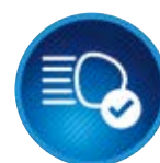
Automatyczne światła drogowe (AHB)

System wysyła sygnały dźwiękowe i wyświetla na ekranie TFT informacje o mijanych ograniczeniach prędkości i wybranych znakach drogowych, a także ostrzega o warunkach pogodowych.