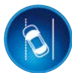
Układ ostrzegania o niezamierzonej zmianie pasa ruchu (LDA)

System wykrywa niebezpieczeństwo zderzenia, wysyła dźwiękowe i wizualne ostrzeżenia, a w razie braku reakcji kierowcy zmniejsza prędkość jazdy lub rozpoczyna awaryjne hamowanie.